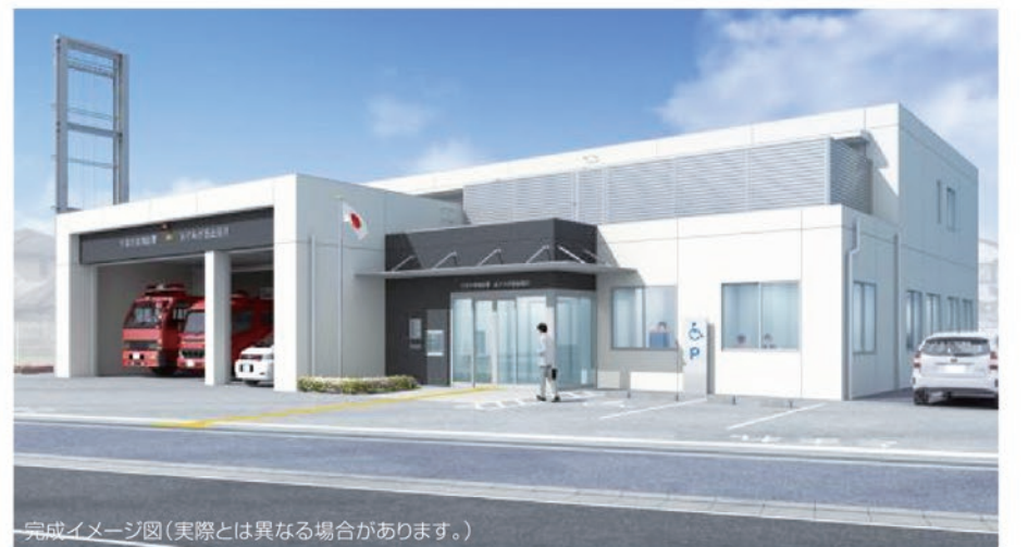
完成イメージ図(実際とは異なる場合があります。)

地域の安全・安心のため、地域の防災拠点となる新たなあすみが丘出張所(仮称)の令和2年度中の早期完成に努め、よりよい消防サービスの提供を目指します。