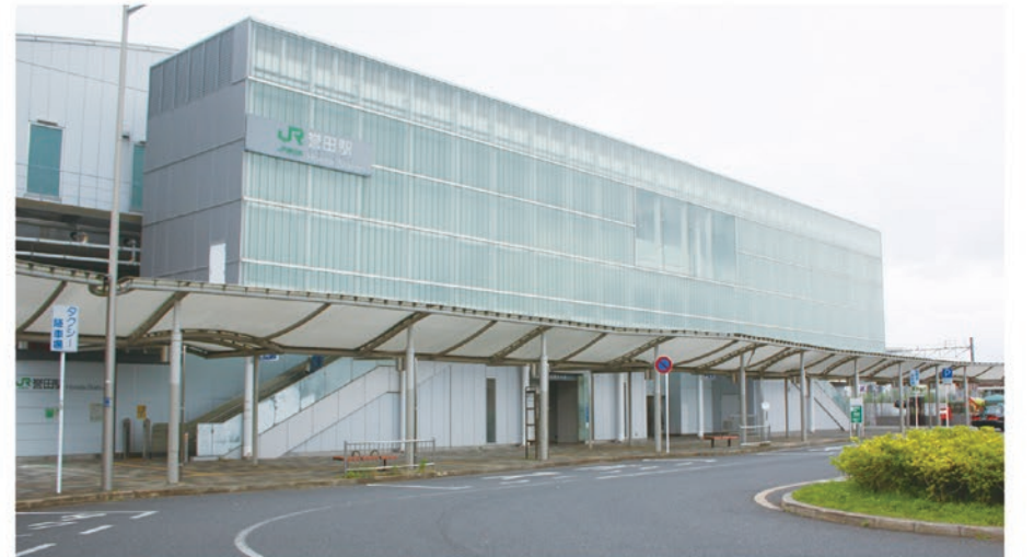
JR外房線「誉田」駅北口

私はこれまで何度も用途地域の見直しについて一般質問で取り上げて参りましたが、誉田駅周辺の魅力を高め活性化を図る好機であり、早急に変更することが必要と考えます。駅北口周辺に仕事帰りに疲れをいやす場所や家族連れで食事を楽しむ場所などが必要だと思えます。将来を見据えて、住環境の変化に対する配慮も必要と思えますので、検討を早く進めていただきたいと思います。