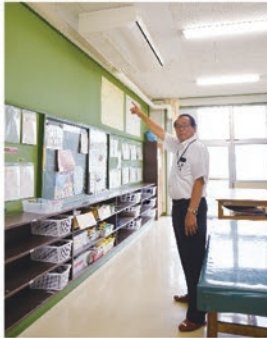
※写真は令和元年7月誉田中学校特別支援教室に設置済エアコンを確認。

*上記以外で、大規模改造に合わせて設置するもの、適正配置校で簡易エアコンを設置するもの等あり