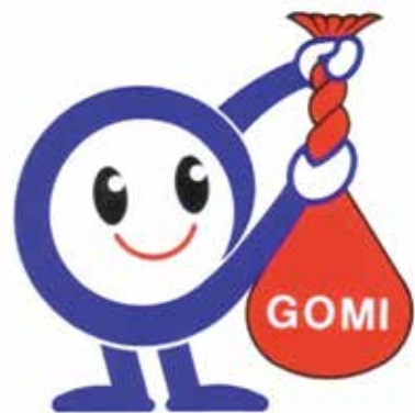
「焼却ごみ1/3削減」キャラクター へらそうくん

みす和夫も率先して減量活動を行いますので区民の皆様も一緒にご協力をお願いします。